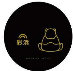
丸盆：「彩浜」デザイン（黒）