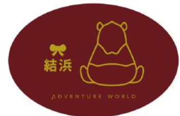
弁当箱：「結浜」デザイン（赤）